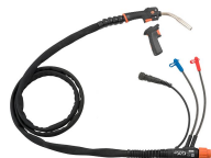
GXe 308WA (+GRe80)

300 A, refrigerada por gas, 3,5 m o 5 m, conector Euro con Amphenol