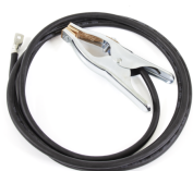
Earth return cable 25 mm 2 , 5 m