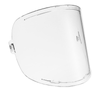
Zeta Grinding visor

De universele lederen halsbeschermer kan worden gebruikt met alle persoonlijke beschermingsmiddelen van Kempki en andere leveranciers van lastechnologie en levert betrouwbare bescherming van hals en schouders tegen hete lasspatten en slijpvonken.