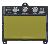
SA 60Z ADF

Сварочный светофильтр с автоматическим затемнением для сварочных масок Zeta с большой площадью обзора 110 мм x 60 мм. Выбор степени затемнения: 2,5/8-12.