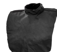
Universal leather neck protector

Предварительный фильтр для блока PFU 210e PAPR. В упаковке 10 шт.