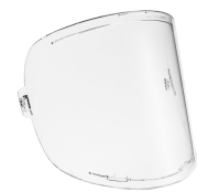
Zeta Grinding visor

通用皮革颈部保护器可保护颈部和肩膀不受焊接飞溅和磨削的影响，可与所有肯倍个人防护设备以及更广泛的焊接市场产品一起使用。