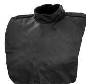
Universal leather neck protector

通用皮革颈部保护器可保护颈部和肩膀不受焊接飞溅和磨削的影响，可与所有肯倍个人防护设备以及更广泛的焊接市场产品一起使用。